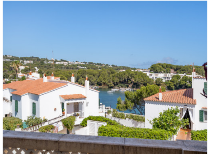
Vistas al mar