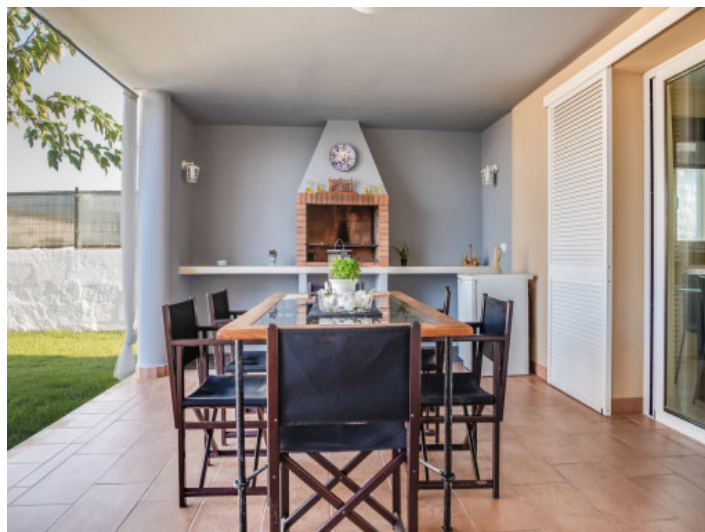
Terraza cubierta con barbacoa