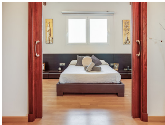
Dormitorio en la planta superior con puerta corredera