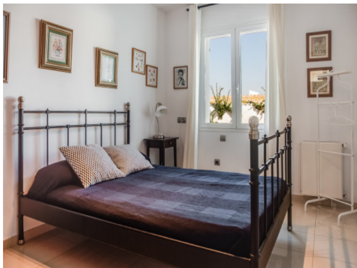
Uno de in total 4 dormitorios