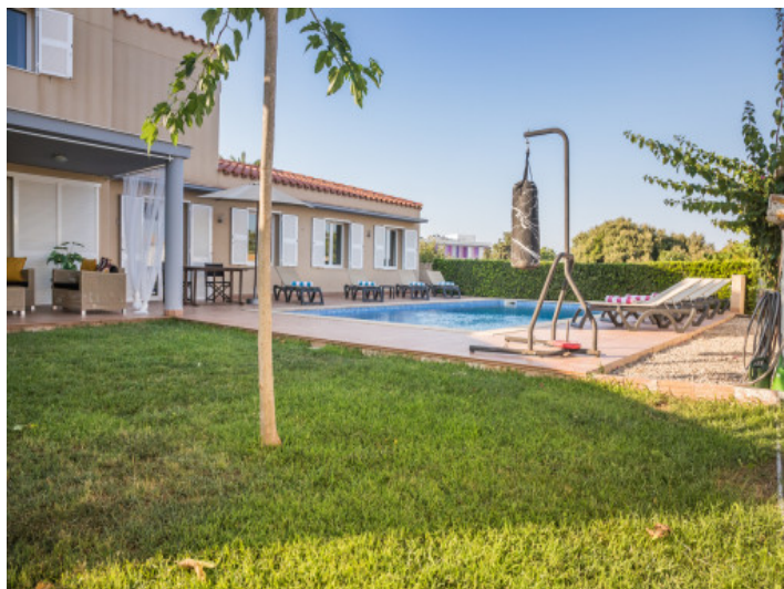
Jardín bien cuidado con piscina