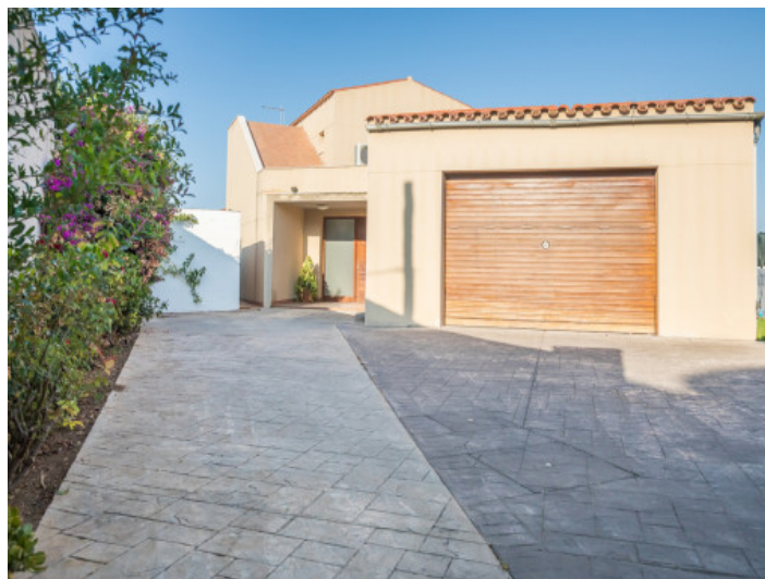
Acceso al chalet con garaje