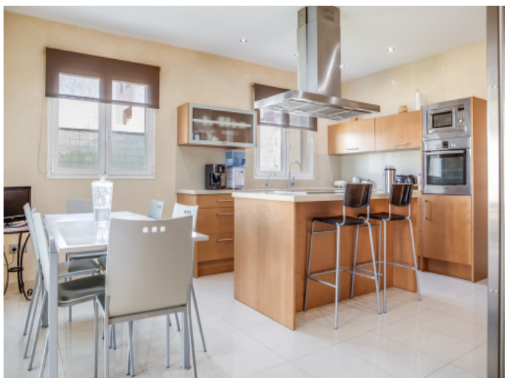
Cocina de alta calidad y isla central