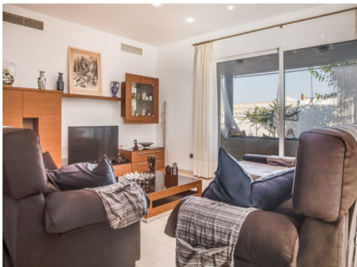
Sala de estar con acceso a la terraza