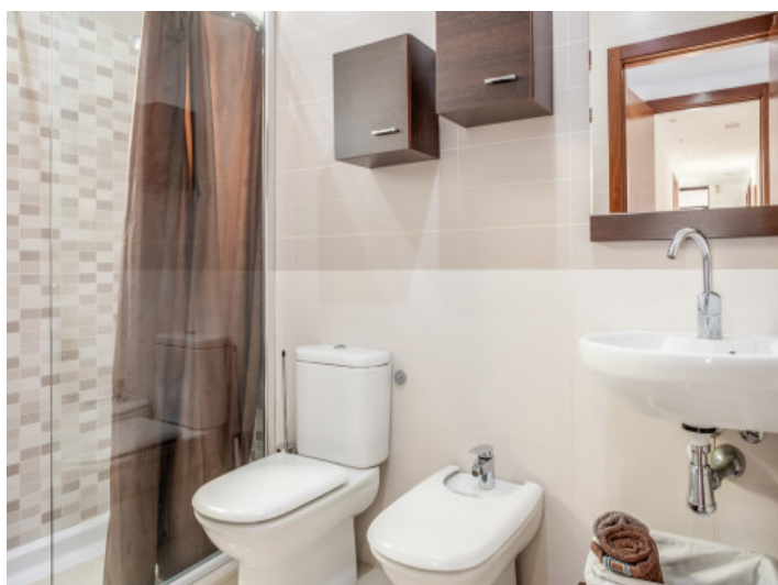
Uno de 4 baños bonitos