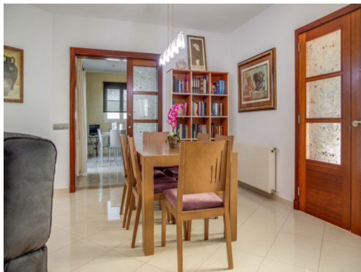
Comedor con acceso directo a la cocina