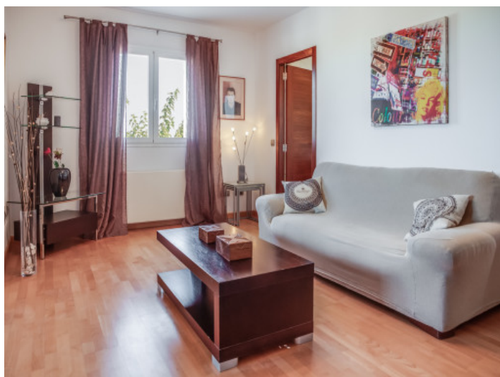
Sala de estar en la planta superior