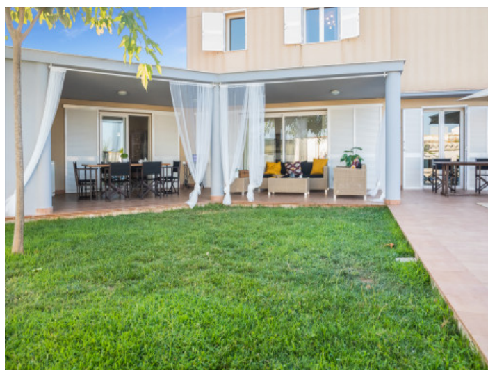
El exterior ofrece una amplia terraza

Toda la información como mejor se puede saber, salvo por error durante el periodo de venta. Sirva este documento como un informe previo, las bases legales solo serán válidas a través de un contrato de compra acordado ante Notario.