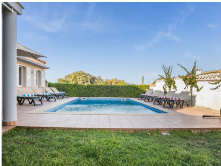
Piscina preciosa con hamacas para relajarse