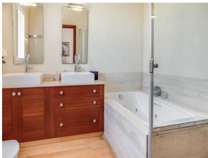
Baño moderno con bañera