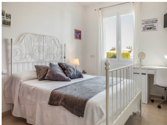
Hermoso dormitorio doble en la planta baja

Toda la información como mejor se puede saber, salvo por error durante el periodo de venta. Sirva este documento como un informe previo, las bases legales solo serán válidas a través de un contrato de compra acordado ante Notario.