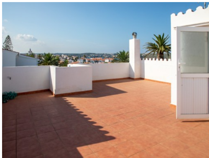
Azotea soleada de la casa