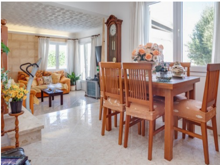
Salón-comedor inundado de luz