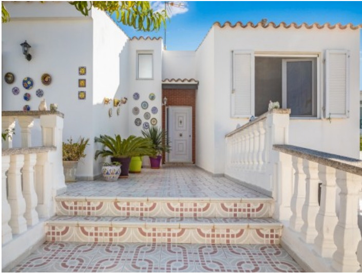
Hermosa casa con vistas panorámicas en Sol del Este