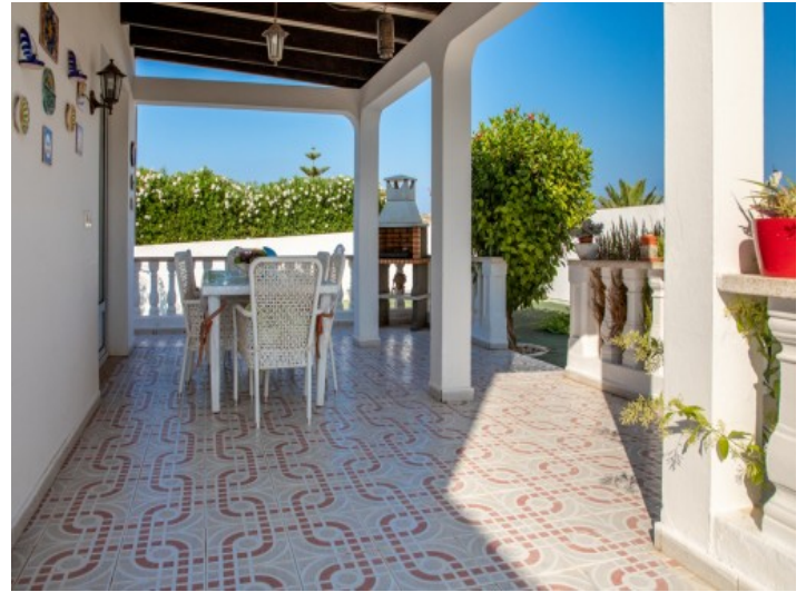
Comedor cubierto en el jardín