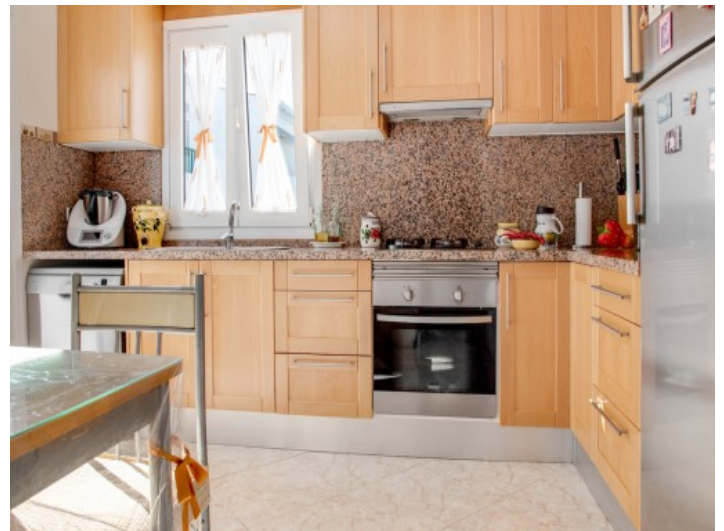
Cocina totalmente equipada de madera