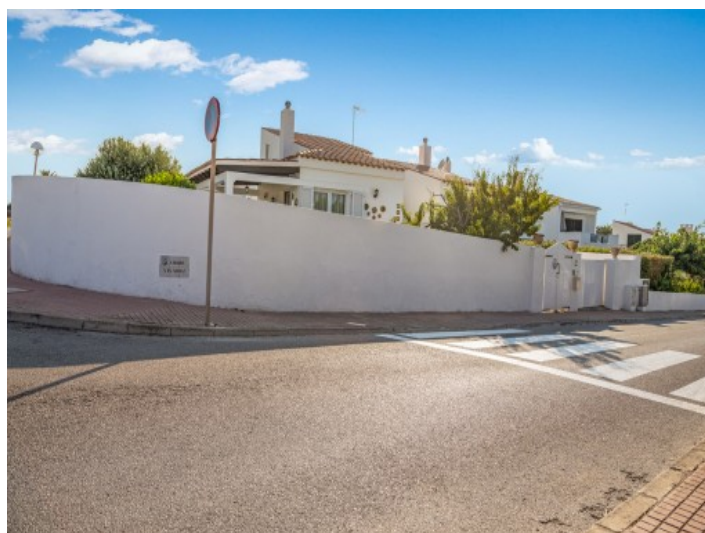
Vista exterior del chalet

Toda la información como mejor se puede saber, salvo por error durante el periodo de venta. Sirva este documento como un informe previo, las bases legales solo serán válidas a través de un contrato de compra acordado ante Notario.