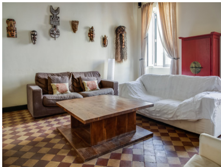
Sala de estar espaciosa con calefacción