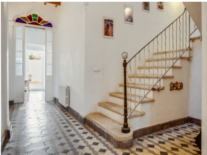
La casa tiene su encanto especial gracias al suelo con baldosas coloridas