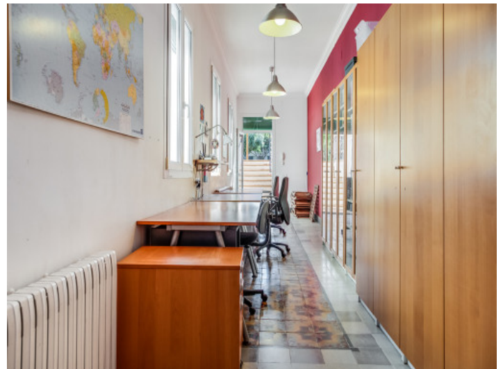
Despacho muy largo con acceso a la terraza