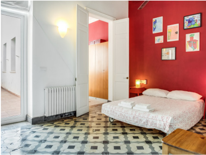
Uno de 5 dormitorios preciosos