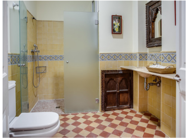
Baño en un estilo auténtico