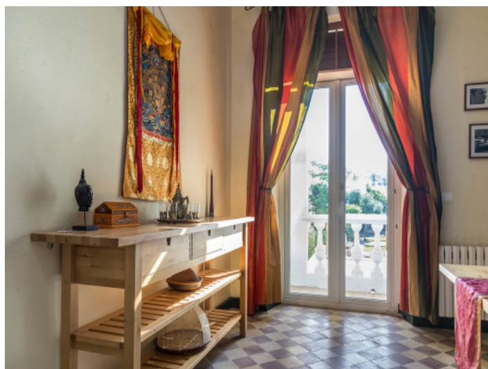
El comedor ofrece acceso al espacio exterior