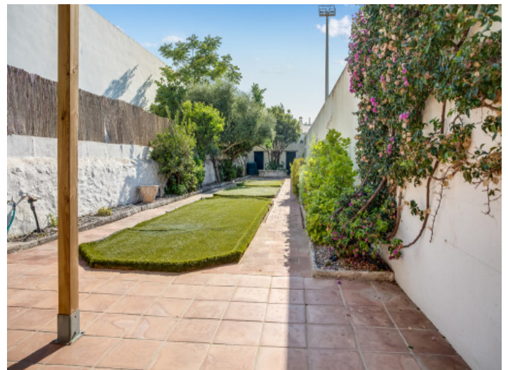
El jardín ofrece privacidad

Toda la información como mejor se puede saber, salvo por error durante el periodo de venta. Sirva este documento como un informe previo, las bases legales solo serán válidas a través de un contrato de compra acordado ante Notario.