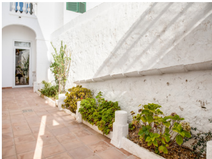
Acceso a la casa de pueblo