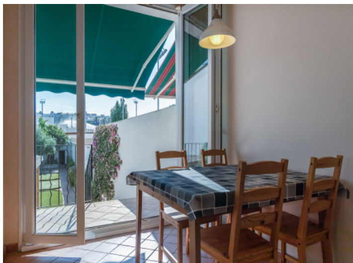
Otro comedor con acceso directo al jardín