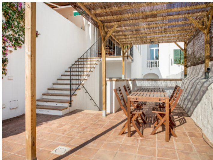
Terraza soleada con comedor