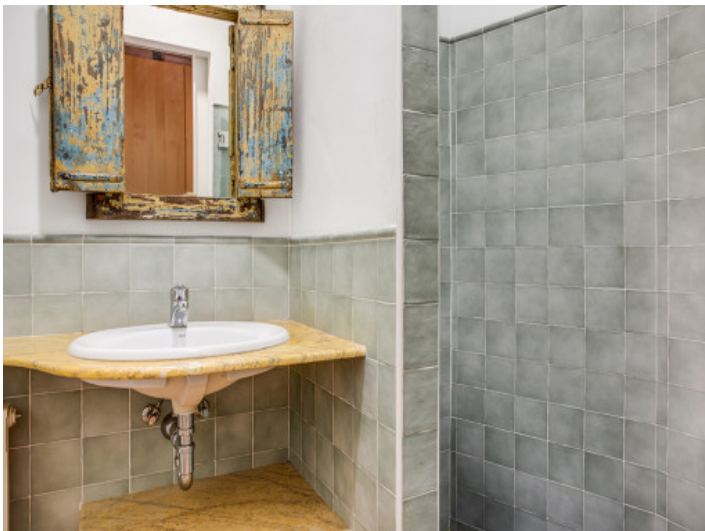
Uno de 4 baños únicos