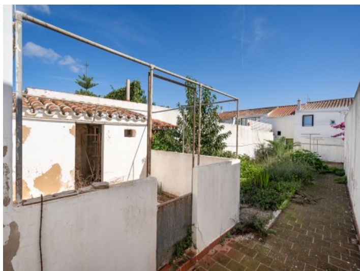
Terraza y jardín