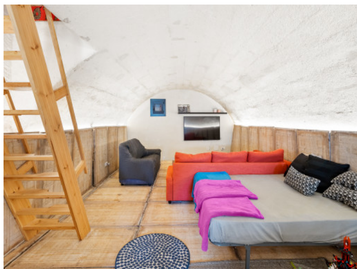
Salón en el souterrain