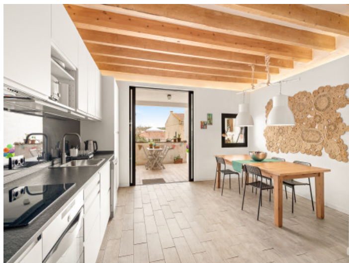
Hermosa cocina con terraza

Toda la información como mejor se puede saber, salvo por error durante el periodo de venta. Sirva este documento como un informe previo, las bases legales solo serán válidas a través de un contrato de compra acordado ante Notario.