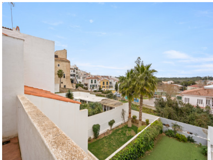
Vista desde la terraza