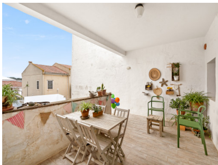
Comedor en la terraza