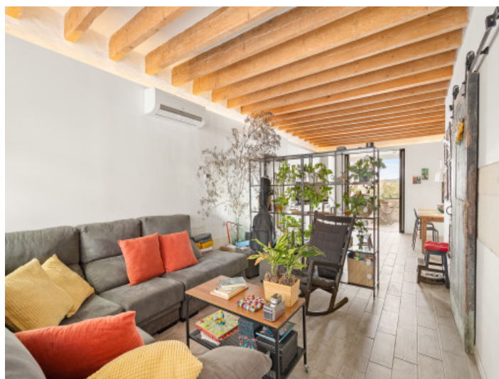
Precioso salón con vigas de madera