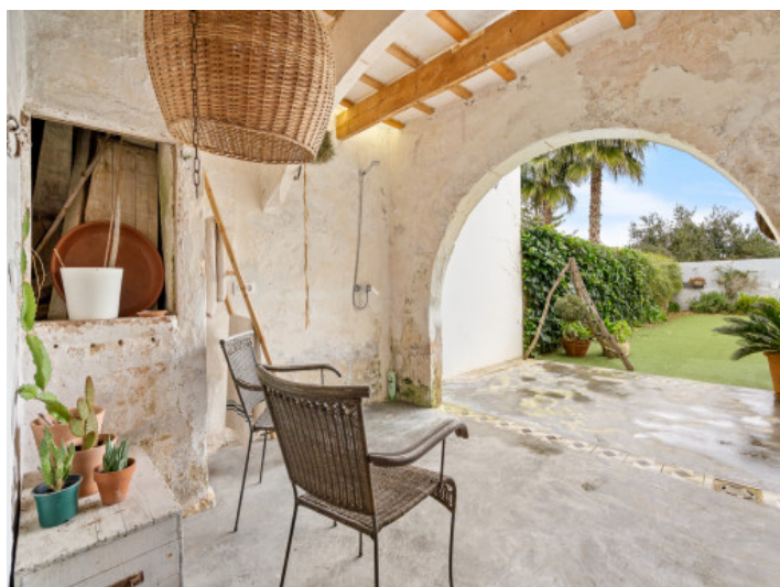
Otra terraza en el jardín