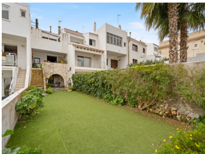
Casa y jardín espacioso