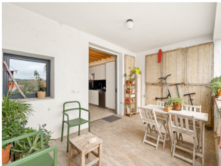
Fantástica terraza cubierta