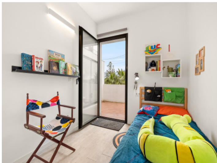
Habitación con otra terraza