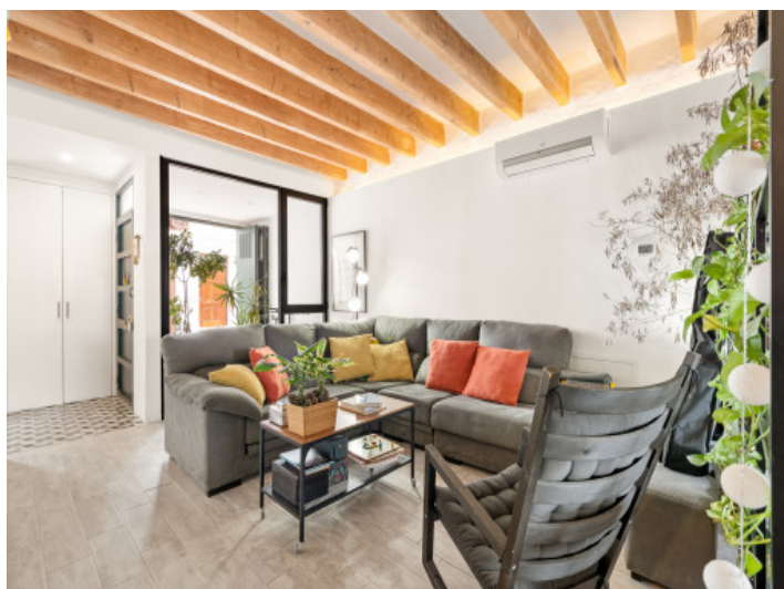
Salón agradable y entrada