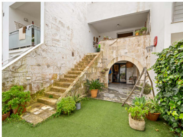
Jardín y acceso al souterrain