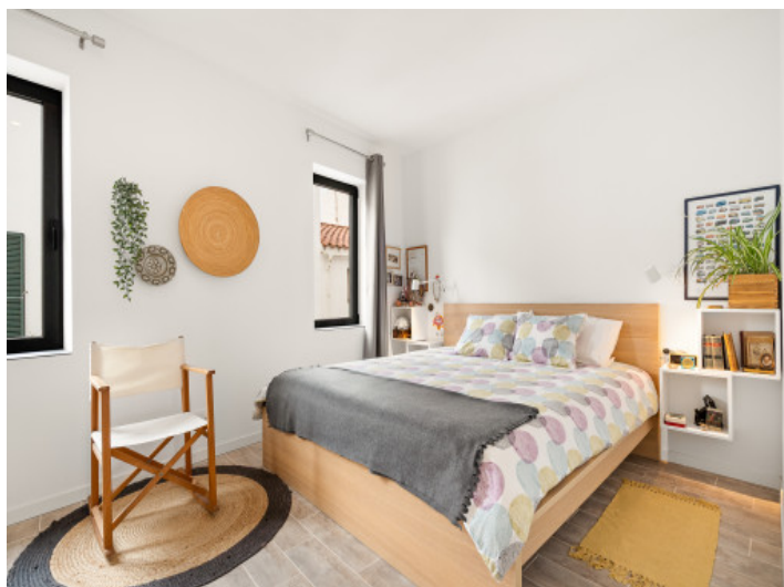
Dormitorio doble en la primera planta