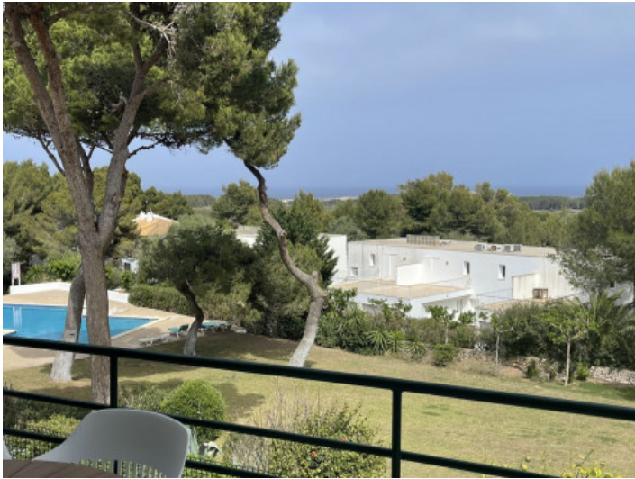
Vistas al mar