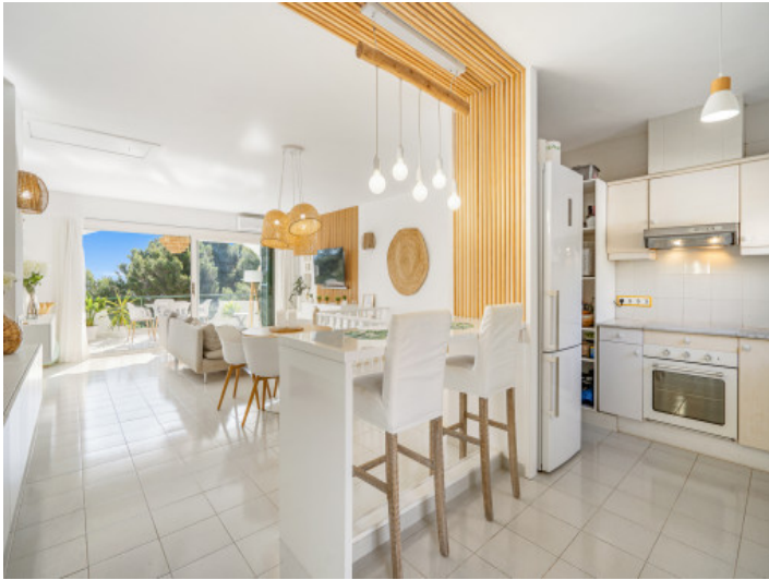
Área de desayuno