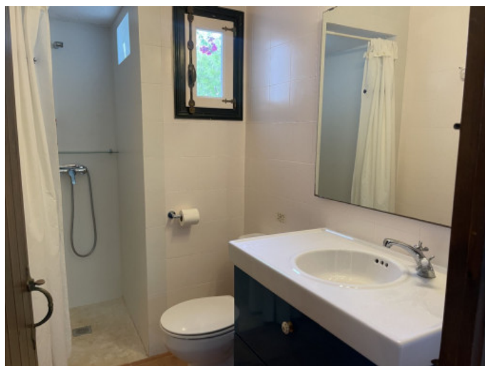
Chalet con 2 baños