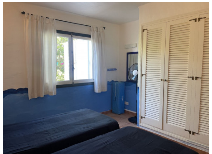
Uno de 3 dormitorios

Toda la información como mejor se puede saber, salvo por error durante el periodo de venta. Sirva este documento como un informe previo, las bases legales solo serán válidas a través de un contrato de compra acordado ante Notario.