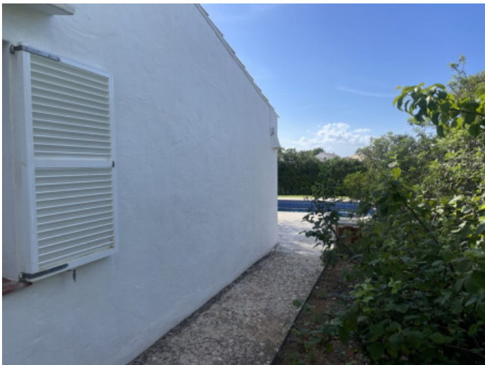
Fachada lateral y piscina