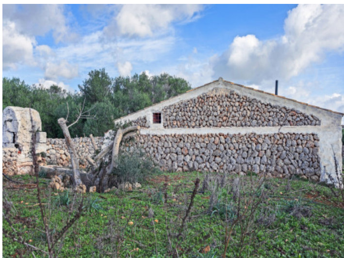
Vista de la fachada