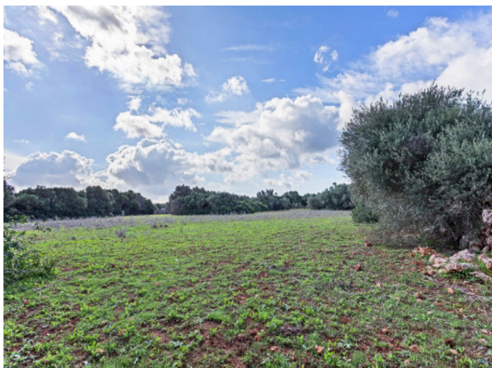
Vista del terreno