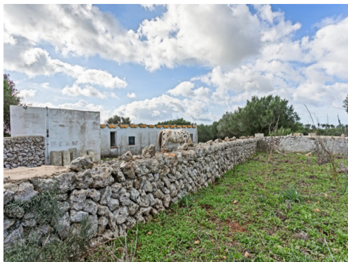
Vista del terreno

Toda la información como mejor se puede saber, salvo por error durante el periodo de venta. Sirva este documento como un informe previo, las bases legales solo serán válidas a través de un contrato de compra acordado ante Notario.