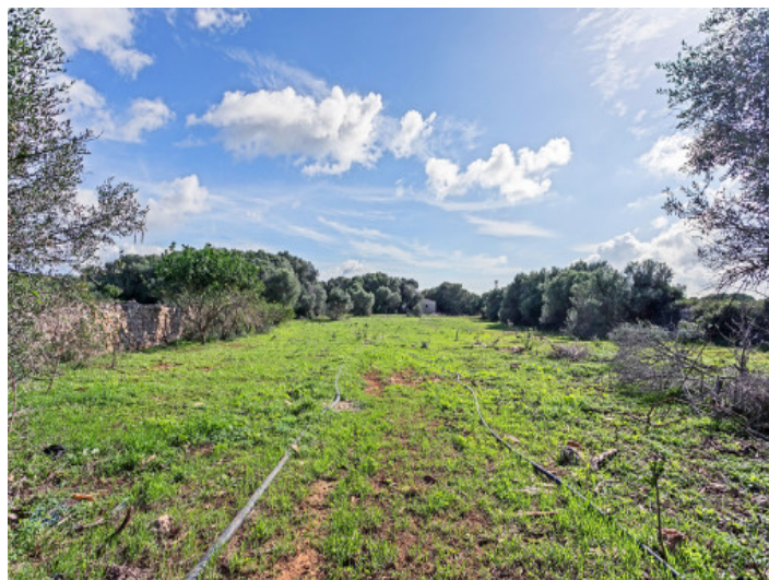
Vista del terreno