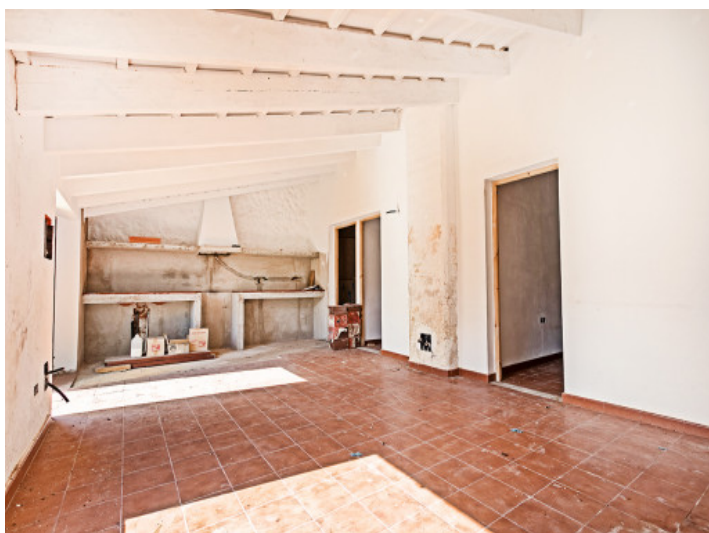
Gran habitación con cocina