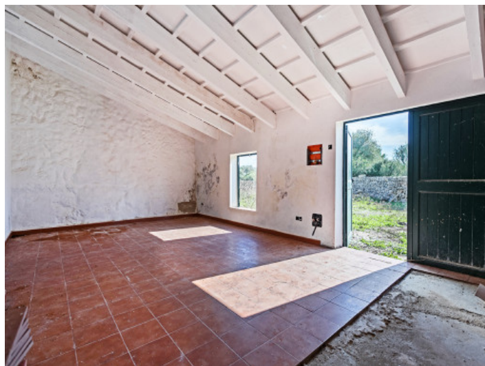
Entrada a la casa