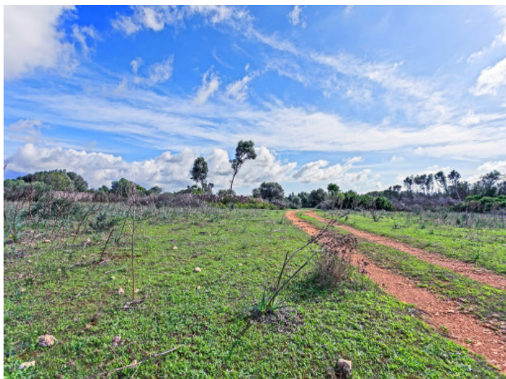
Gran terreno de 22 ha