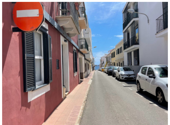
Terreno 3 vistas mar desde calle

Toda la información como mejor se puede saber, salvo por error durante el periodo de venta. Sirva este documento como un informe previo, las bases legales solo serán válidas a través de un contrato de compra acordado ante Notario.